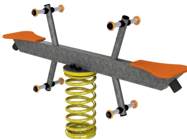
Ref. ELMOL026 (Arrows)