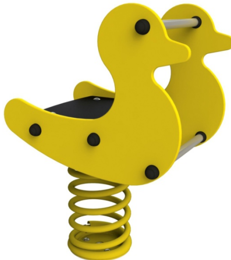
Ref. ELMOL001S (Patos)