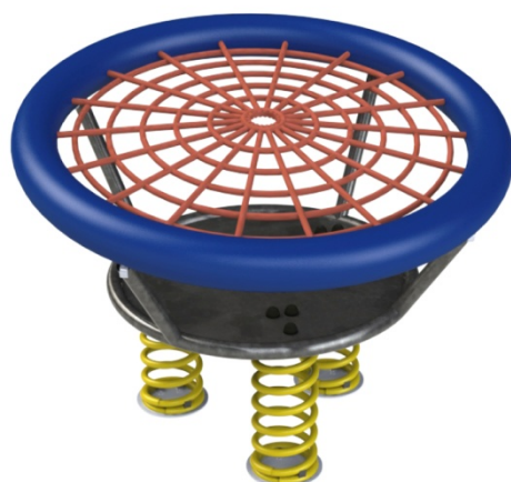
Ref. ELMOL034 (Cadeira Rede)