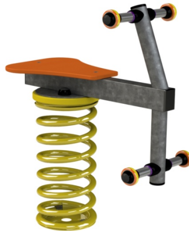
Ref. ELMOL005 (Arrow)

(Fotografias de los equipamientos de juego // Pictures of playground equipment // Photographies de l'équipement de jeu)