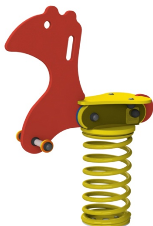
Ref. ELMOL003 (Amber)